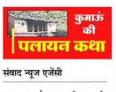
सिस्टम को कोस रहा विकास से कोसों दूर चुपचाप खड़ा सिरकोट